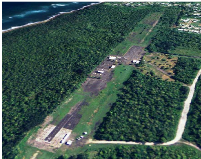
Foto aérea del 2004