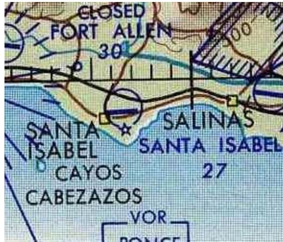
De un mapa de la Fuerza Aérea de 1964