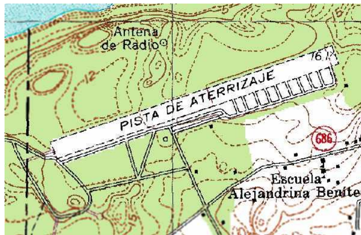
Mapa de 1977

Fue establecido en una finca de 554 acres que el gobierno estadounidense compró en 1941 en el noroeste municipio de Vega Baja. El Ejército construyó la pista y una serie de otras instalaciones. Sirvió como aeropuerto auxiliar de la Base Ramey y como centro de entrenamiento militar entre 1941 y 1956. Desde entonces y hasta 1975 fue utilizado como centro de entrenamiento por la Guardia Nacional; un año más tarde se traspasó la titularidad de esos terrenos y facilidades al Gobierno de Puerto Rico. Con el tiempo esta instalación se convirtió en un centro de práctica para aprendices de conductores de automóviles y área de entretenimiento y recreación para pilotos de modelos de avión.