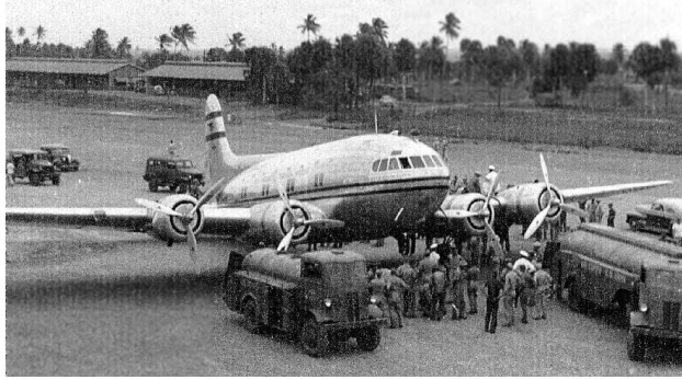
Fuerte Allen: Visita de un Boeing Stratoliner c. 1941

Fue establecido en 1941 en el sur de Puerto Rico, en el municipio de Salinas por el cuerpo aéreo del Ejército. También se construyeron facilidades para el acuartelamiento de tropas. Cuando en 1942 ese personal fue trasladado a Gran Bretaña, las mismas fueron inactivadas y cerradas para operaciones aéreas.