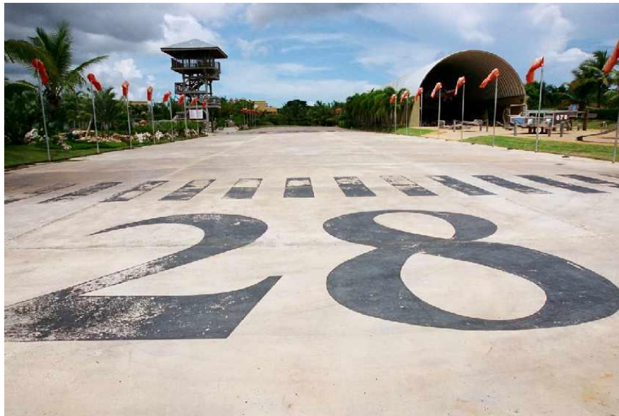
Aeropuerto de Dorado en 2003

quien la utilizó para desarrollar un complejo hotelero. Entonces, el aeropuerto se reabrió como instalación privada comercial a principios de la década de 1960 y estuvo operando hasta mediados de la década de 1980.