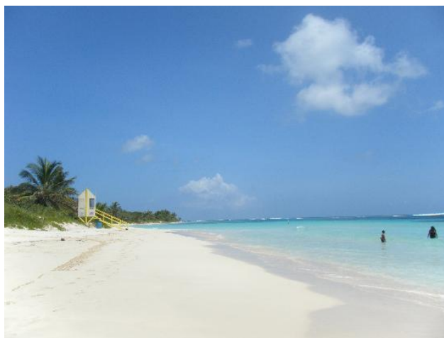
Playa de Flamenco en la actualidad

Desde 1939 la marina estadounidense utilizó gran parte de esta isla, particularmente el área de la Playa de Flamenco, como polígono de tiro para la práctica de bombardeos costeros y análisis de los resultados del lanzamiento de proyectiles. Esta actividad estaba coordinada desde la Estación Naval de Ceiba.