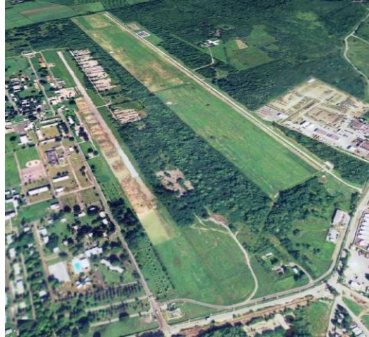
Pista del Fuerte Allen en 2004

Mas tarde en la misma década la Marina estableció parte del sistema de radares, o sistema de antenas, ROTHER (más allá del horizonte) en Fort Allen. Ello tras la oposición de amplios sectores del pueblo puertorriqueño que rechazó la instalación de ese radar en el Valle de Lajas, la principal llanura no costera y reserva agrícola de Puerto Rico. Otra parte de las antenas está en Vieques.