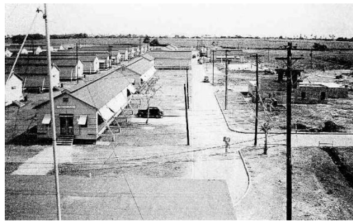
Barracas en 1941

Fue establecido en 1941 en el sur de Puerto Rico, en el municipio de Salinas por el cuerpo aéreo del Ejército. También se construyeron facilidades para el acuartelamiento de tropas. Cuando en 1942 ese personal fue trasladado a Gran Bretaña, las mismas fueron inactivadas y cerradas para operaciones aéreas.