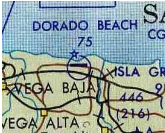
Según un mapa de la Fuerza Aérea de 1964